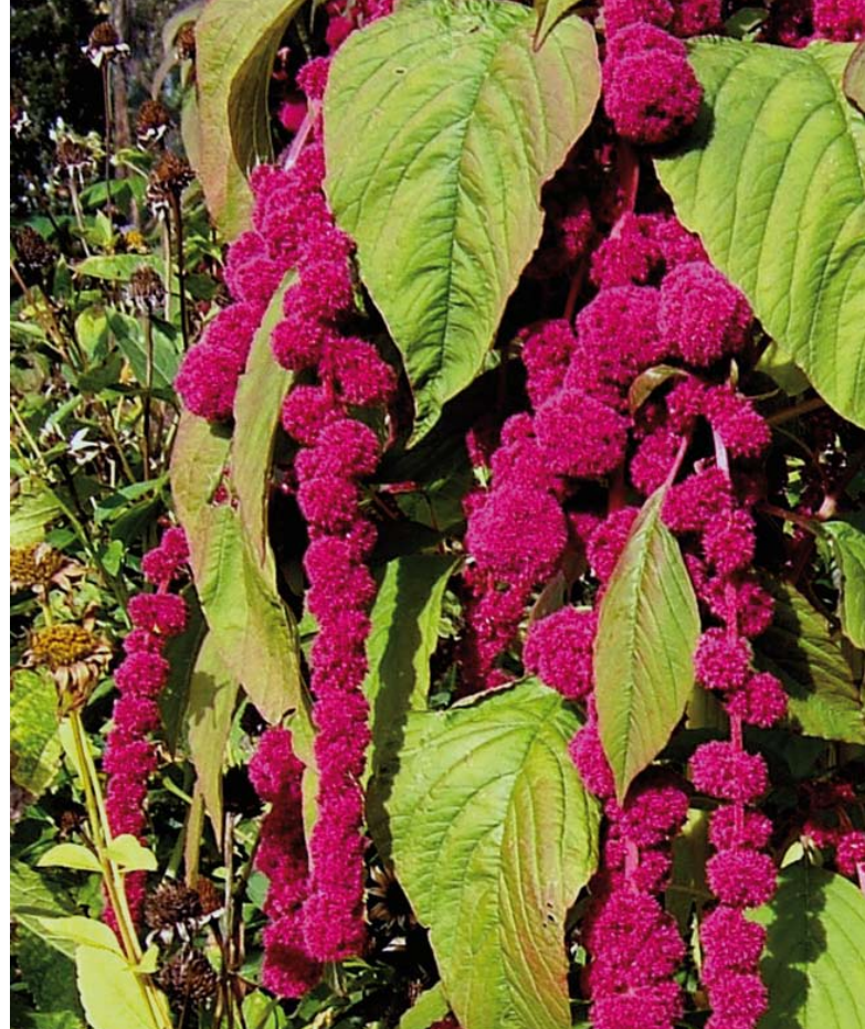
Amarant ( Amaranthus spp.) oder auch Fuchsschwanz genannt, hat seinen Ursprung in Mexiko

Im August 2010 haben sich 20 Netzwerkpartner aus Industrie, Forschung und Marketing zum Netzwerk „Bioaktive Pflanzliche Lebensmittel“ zusammengeschlossen. Unter der Federführung des Steinbeis-Europa-Zentrums treiben sie das Thema „Bioaktivität und Gesundheit“ in Baden-Württemberg voran. Übergeordnetes Ziel ist es, ein besseres Verständnis über funktionelle Pflanzeninhaltsstoffe und deren gesundheitsfördernde Wirkung zu gewinnen. Im Zentrum stehen dabei die beiden südamerikanischen Pflanzen Amaranth und Quinoa. Gefördert wird das Netzwerk über das „Zentrale Innovationsprogramm Mittelstand – ZIM“ des Bundesministeriums für Wirtschaft und Technologie. Das Steinbeis-Europa-Zentrum will dieses Netzwerk ausbauen und nachhaltig in Baden-Württemberg etablieren.